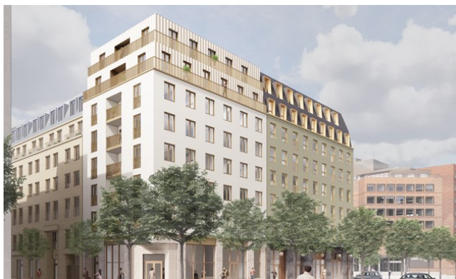
Figur 1, Illustrationsbild Fasad

Arbetet med planlösningen har utgått från Funktionsprogram för bostäder med särskild service enligt SoL och LSS samt stödboende, 2024 2 . Planritningar för servicebostaden redovisas i genomförandebeslutet.